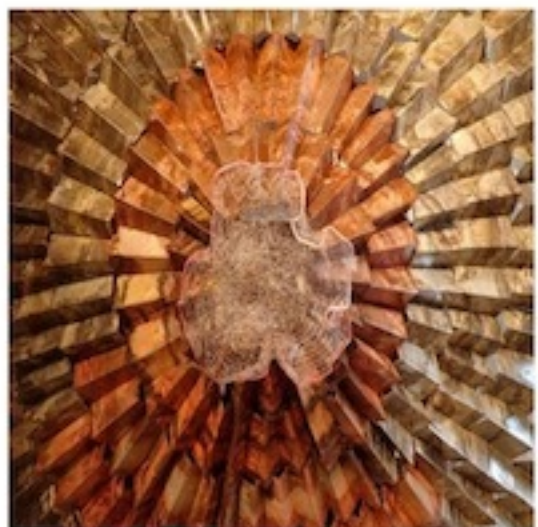
Oeuvre de Naomi Wanjiku Gakunga.

Women Groups des années 1960 qui menaient des projets de logements communautaires où les toits des maisons, en métal, étaient conçus pour récupérer l'eau de pluie.