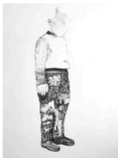
Vincent Bizien, Frère , 2015 — Fusain sur papier, 150 x 120 cm

C'est cette ambiguïté fondamentale d'un fantastique issu d'un imaginaire réel qui