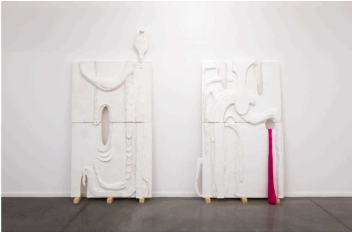
Io Burgard au Mrac Sérignan.