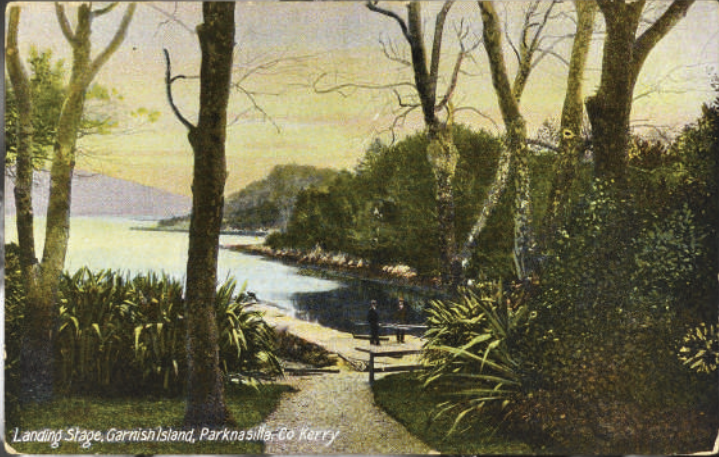
Landing Stage, Garrish Island, Parknasilla, Co Kerry