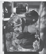
The Kiss, 2023 Collage 25,7 x 22,7 cm