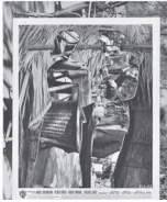
The Kiss, 2022 Collage 29,7 x 23,1 cm