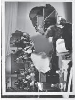
The Kiss, 2022 Collage 25 x 20 cm