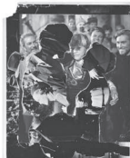
The Kiss, 2023 Collage 25,5 x 20,5 cm