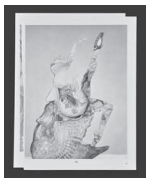
Spell, 2022 Collage 24,4 x 19 cm