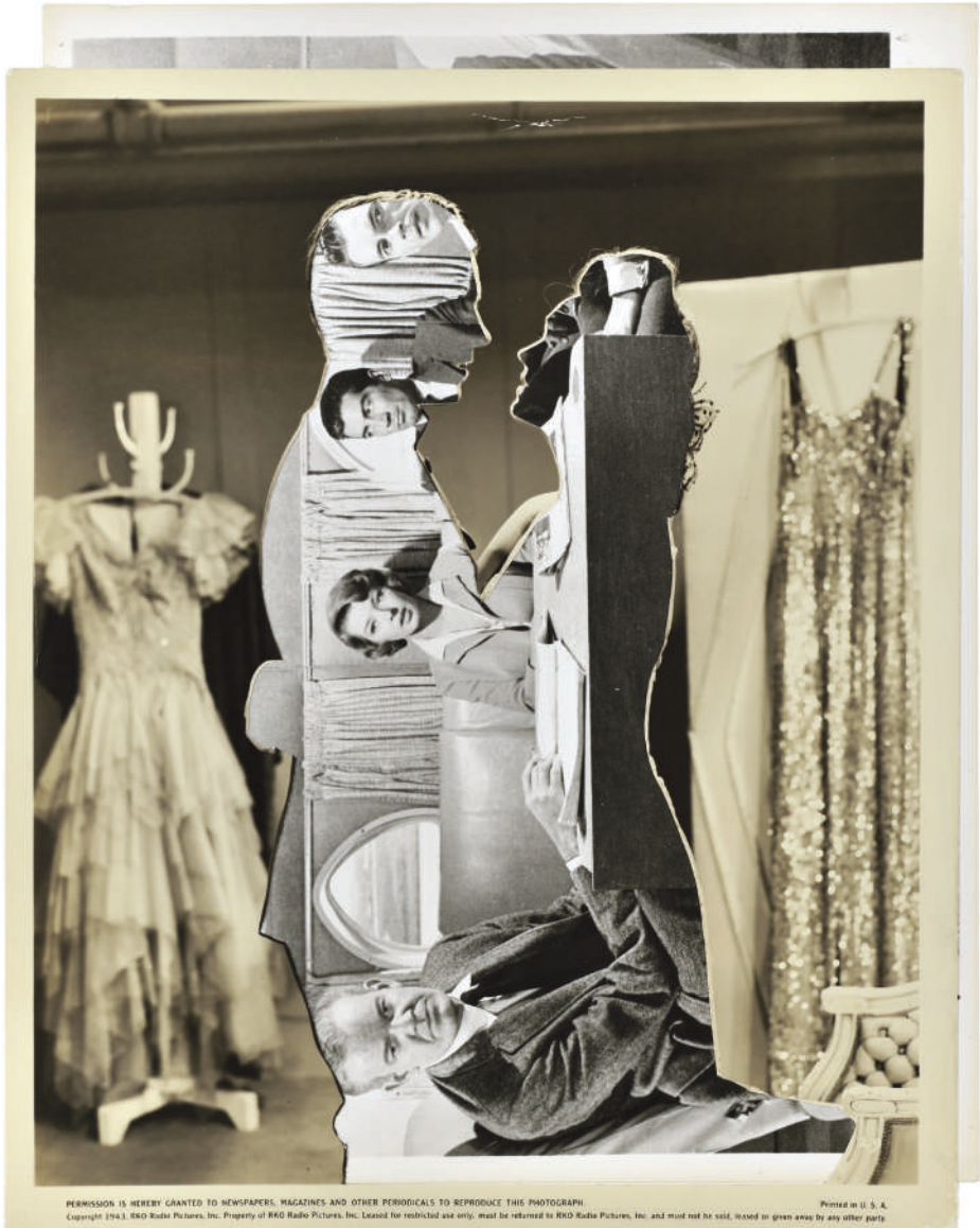
PERMISSION IS HEREBY GRANTED TO NEWSPAPERS, MAGAZINES AND OTHER PERIODICALS TO REPRODUCE THIS PHOTOGRAPH. Copyright 1943, RKO Radio Pictures, Inc. Property of RKO Radio Pictures, Inc. Lensed for restricted use only, must be returned to RKO Radio Pictures, Inc. and must not be sold, leased or given away by any other party.