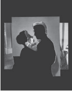
Double Shadow, 2022 Collage 22,4 x 23,6 cm