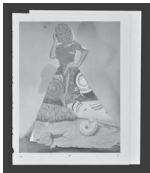
Spell, 2022 Collage 24 x 20,2 cm