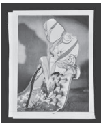
Spell, 2022 Collage 24 x 19 cm