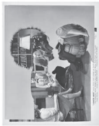
The Kiss, 2022 Collage 25,8 x 20,6 cm