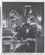
The Kiss, 2022 Collage 26,3 x 20,7 cm