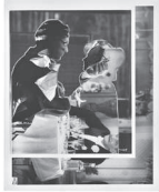
The Kiss, 2022 Collage 30 x 24,2 cm