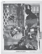
The Kiss, 2022 Collage 26,5 x 21 cm