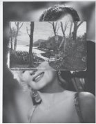
Couple, 2020 Collage 24,3 x 17,8 cm