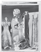
The Kiss, 2022 Collage 26,8 x 21,3 cm