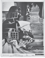
The Kiss, 2022 Collage 25,8 x 20,6 cm