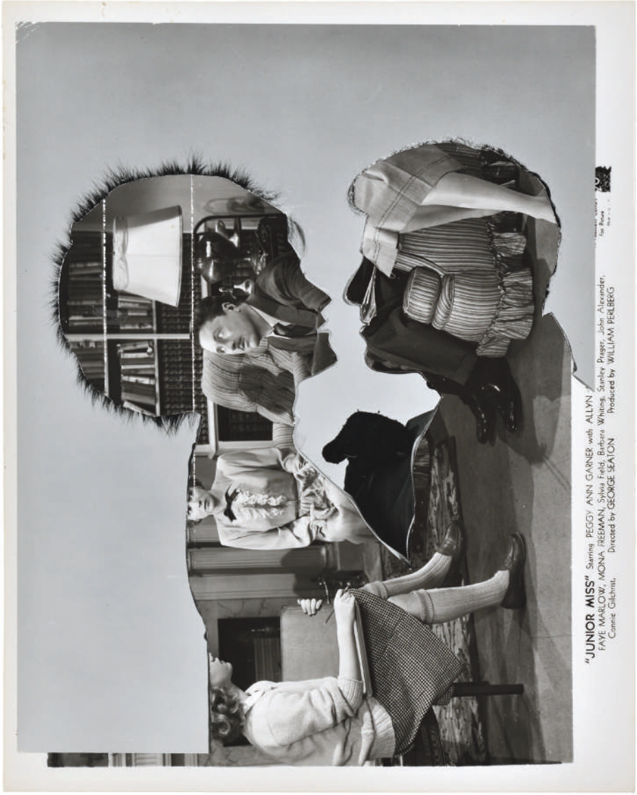
"JUNIOR MISS" Starring PEGGY ANN GARNER with ALLYN FAYE MARLOWE, MONA FREEMAN, Silvia Field, Barbara Whiting, Stanley Prager, John Alexander, Connie Gilchrist. Directed by GEORGE SEATON. Produced by WILLIAM PERLBERG.

Photo by [unreadable] for [unreadable] Photo # [unreadable]