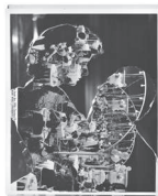
The Kiss, 2023 Collage 25,8 x 20,5 cm