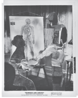
The Kiss, 2022 Collage 26,8 x 20,7 cm